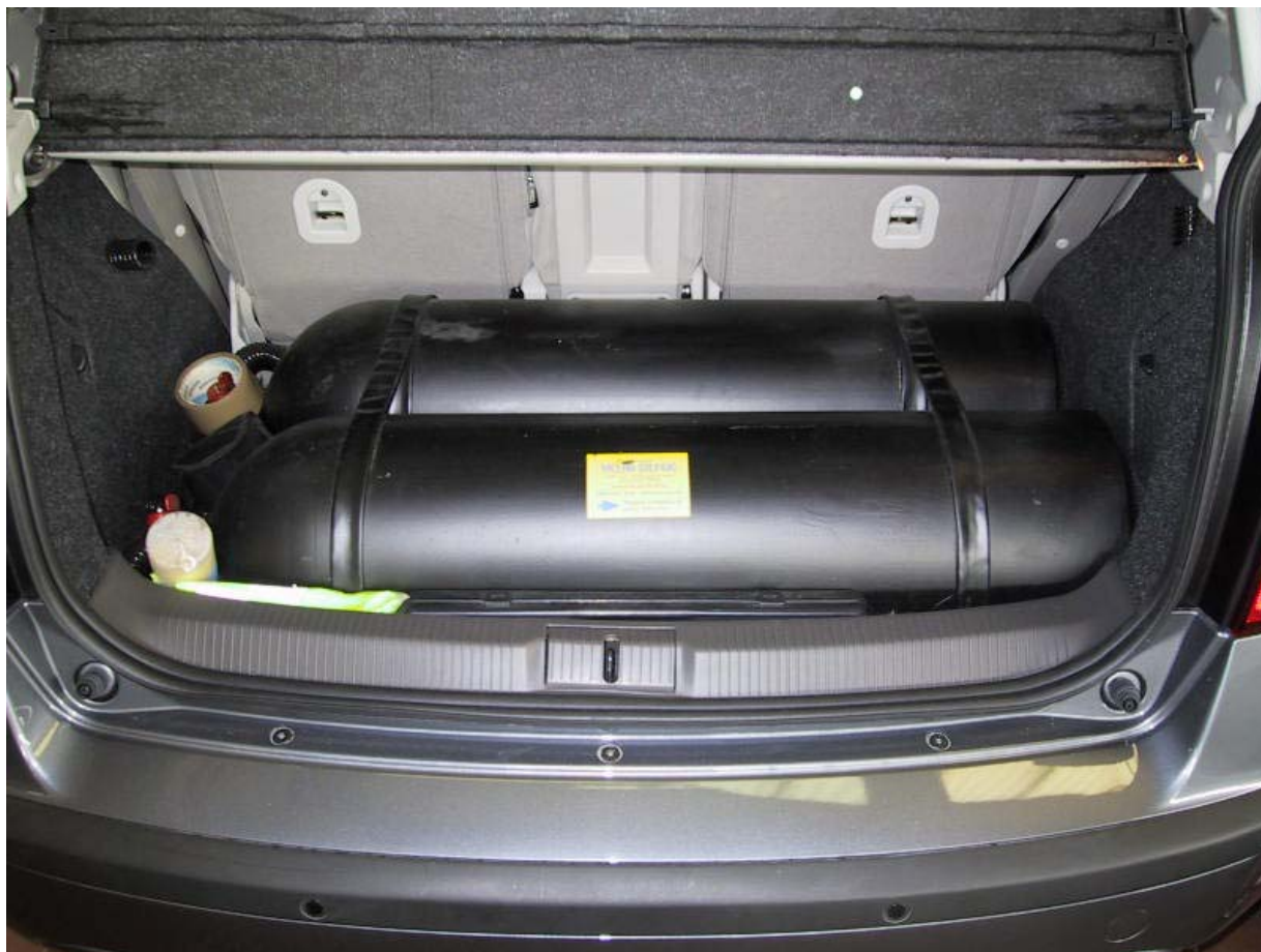
Installazione bombole metano.