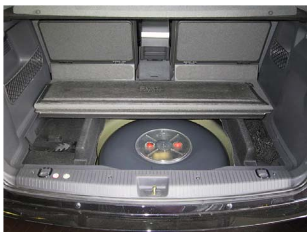
Installazione del serbatoio gpl.