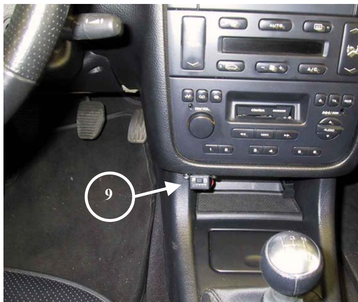
9) Posizione del commutatore