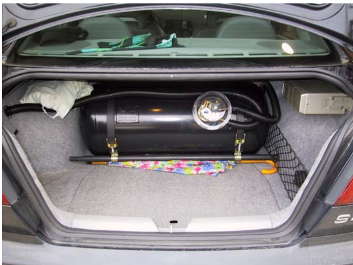
Installazione serbatoio del gas