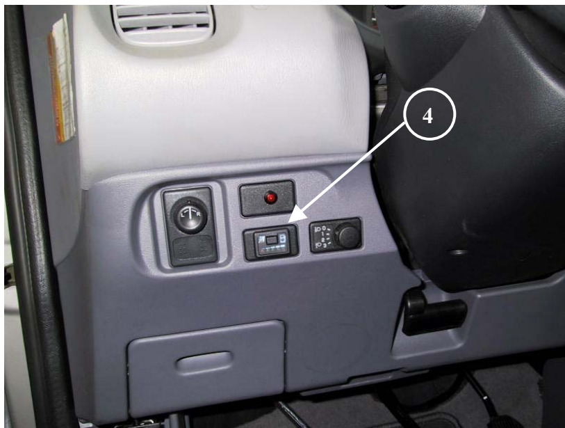
4 ) Posizione del commutatore.