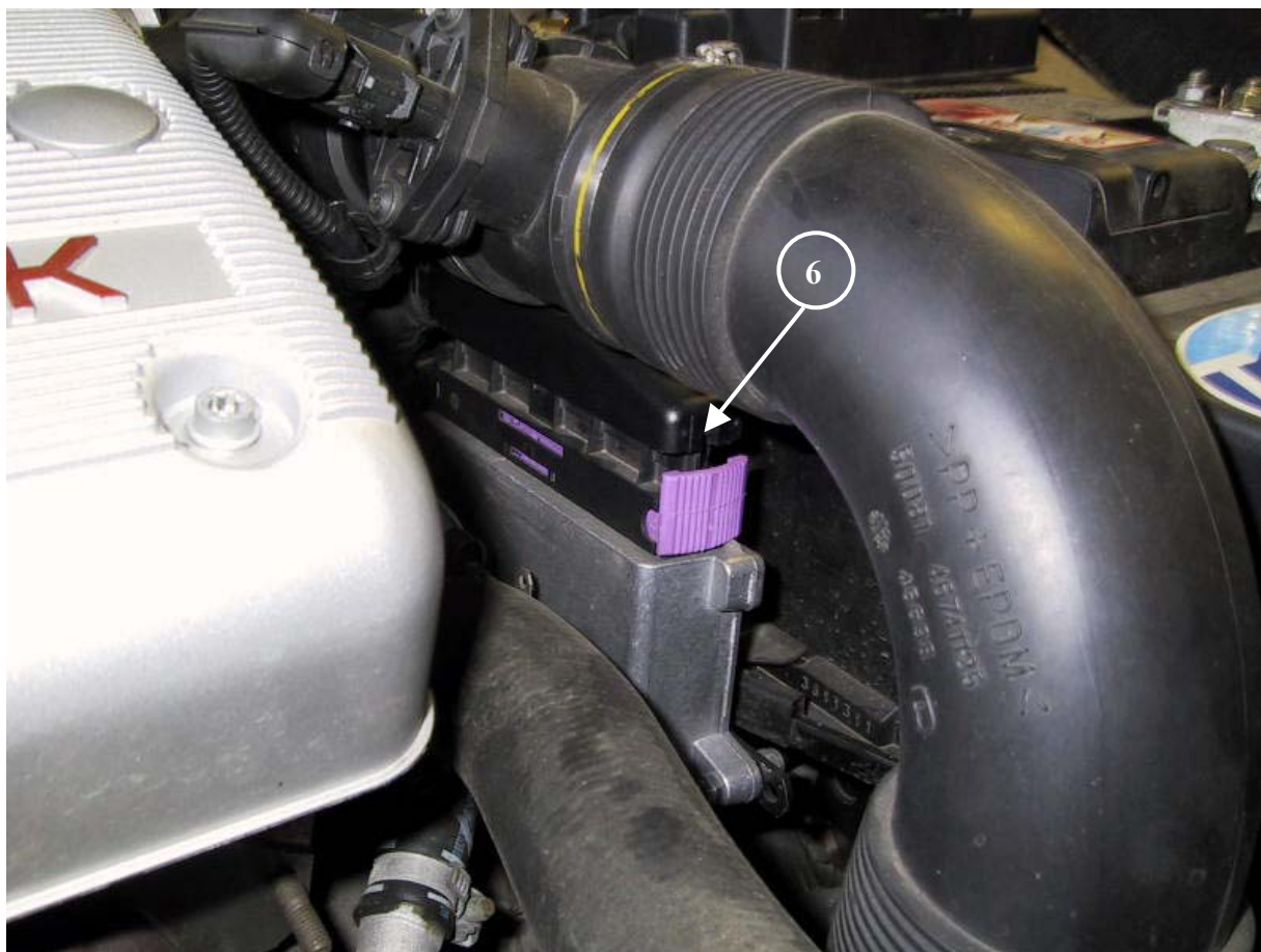
6) Centralina elettronica del gas.