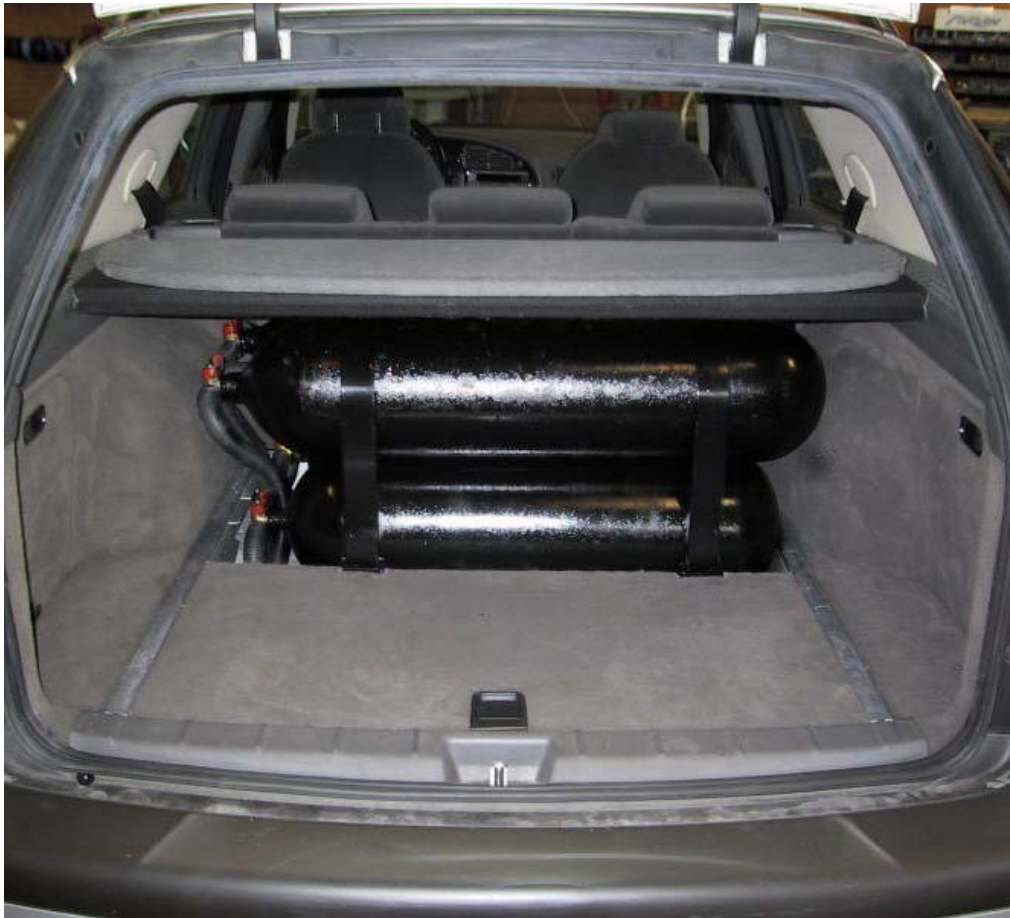
Installazione bombole metano.