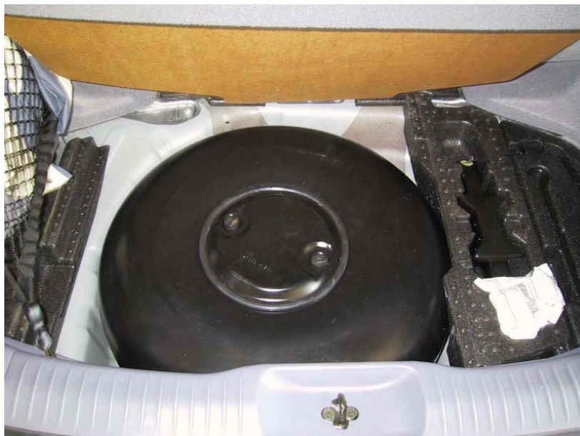
Installazione serbatoio del gas