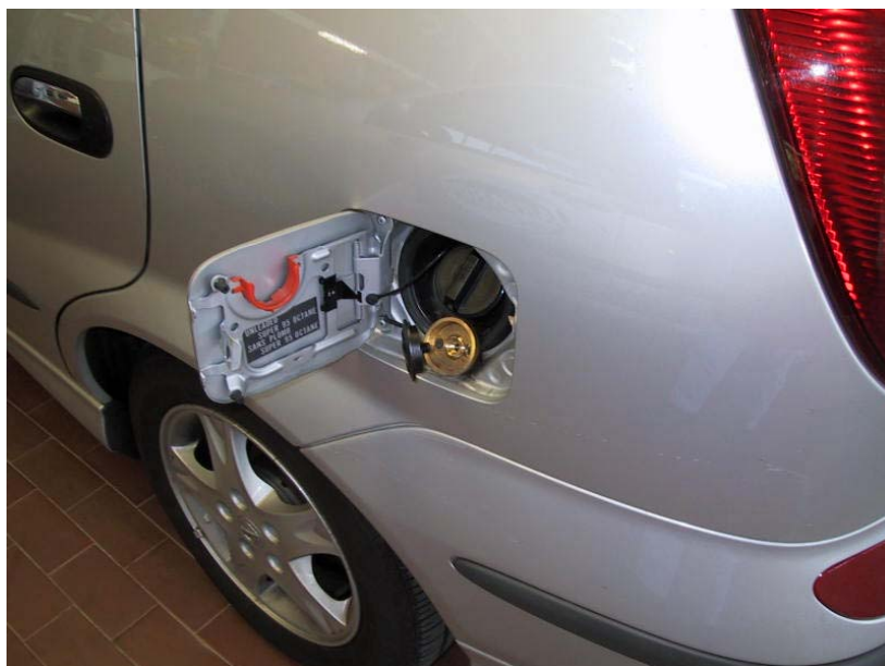
Valvola di carica.