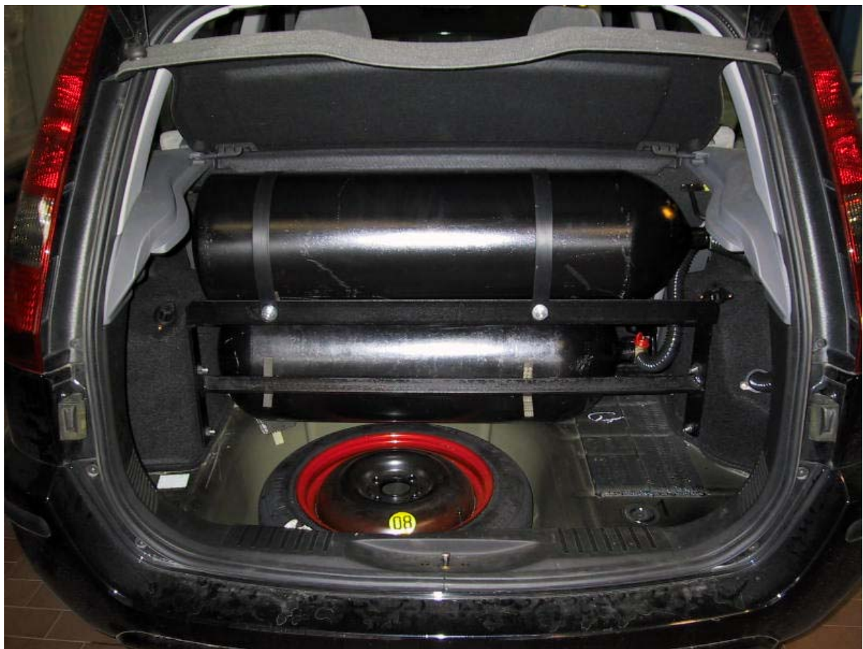
Installazione bombole metano.