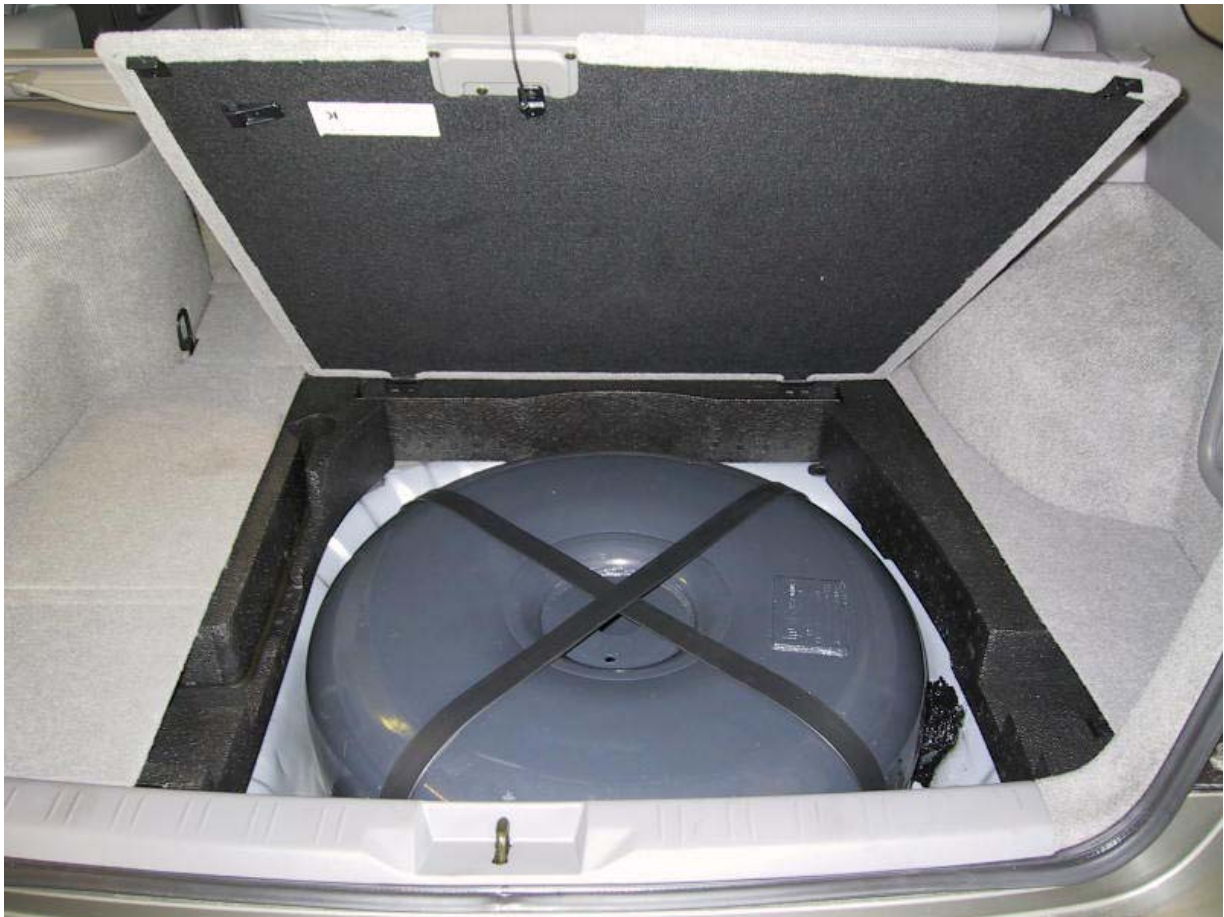
Installazione del serbatoio gpl