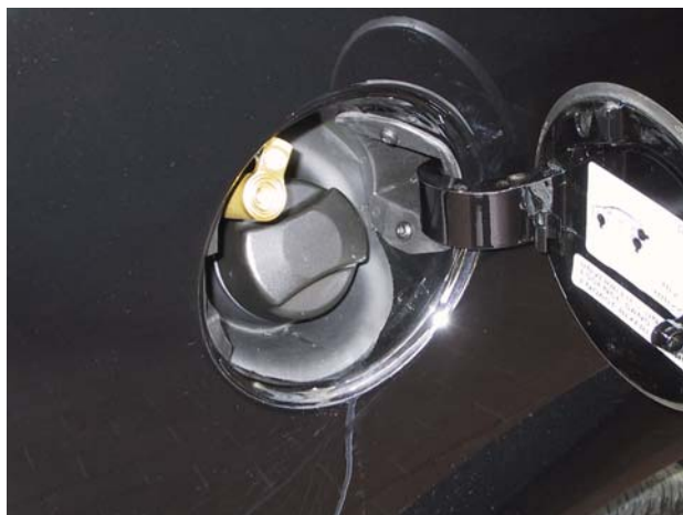
Raccordo di carica.