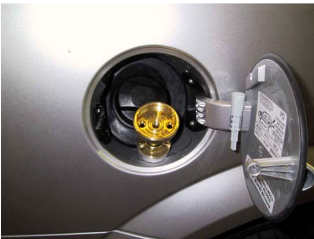
Valvola di carica