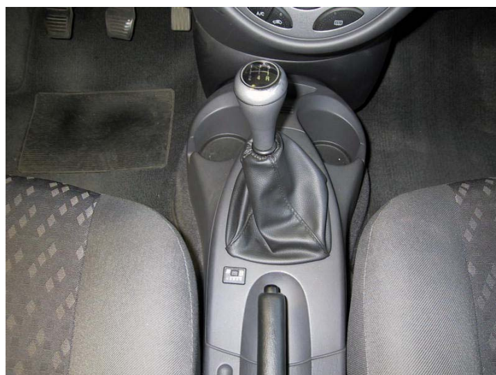
Posizione del commutatore.