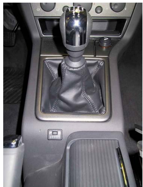
Posizione del commutatore.