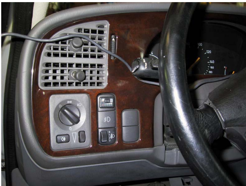
Posizione del commutatore