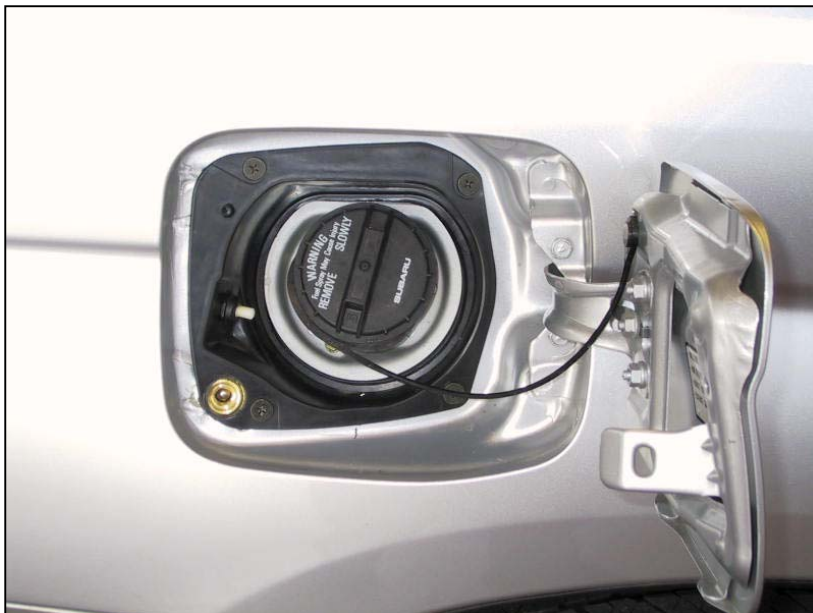
Valvola di carica