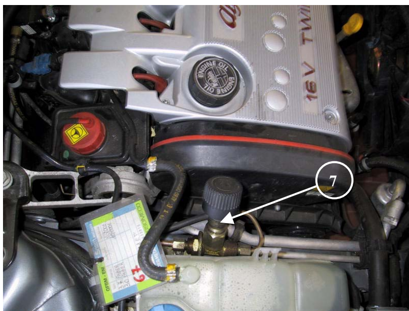
7) Valvola di carica.