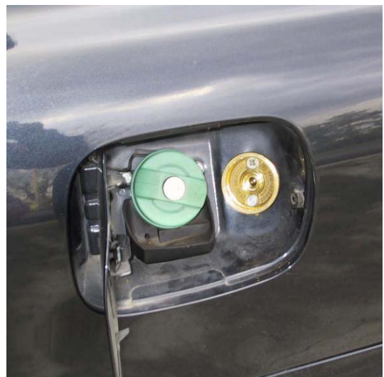
Valvola di carica