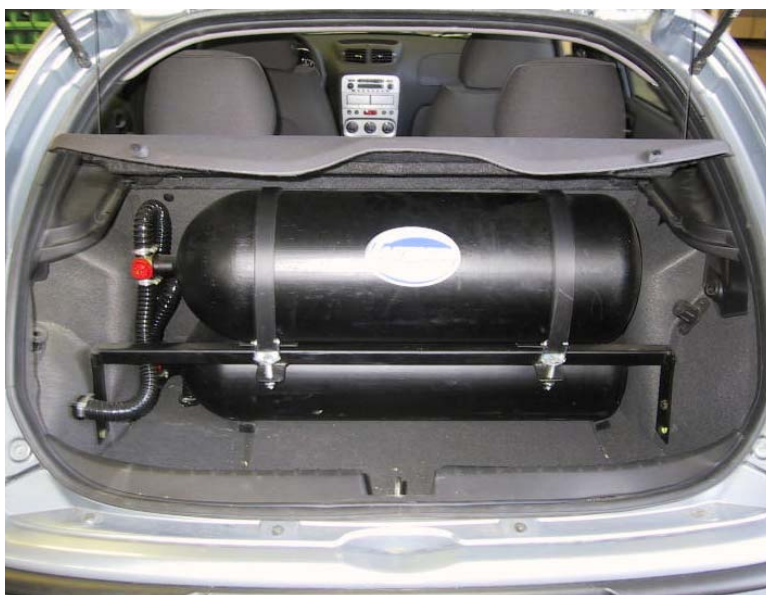
Installazione delle bombole metano