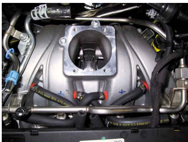
Raccordi di iniezione gas