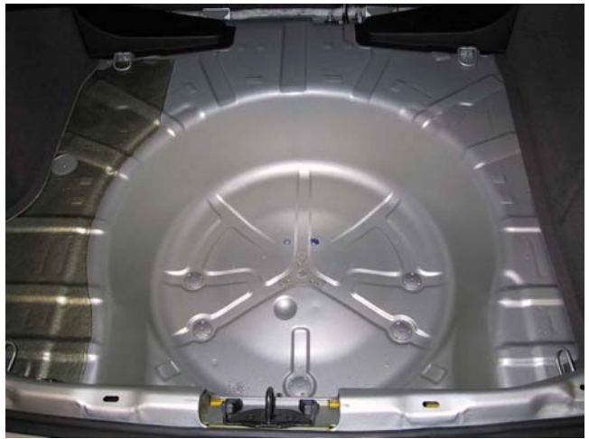
Installazione serbatoio del gas